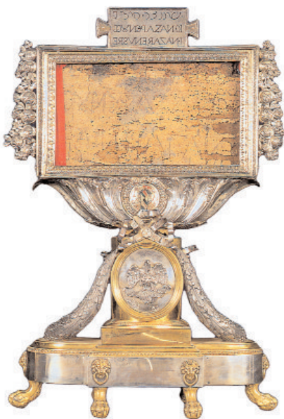
Relicario con el Titulus Crucis. Se escribió en hebreo, griego y latín, pero en los tres casos de derecha a izquierda.