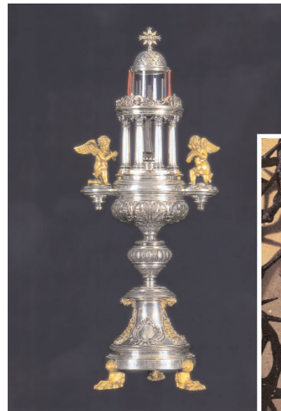
El relicario con el Clavo. Debajo, las espinas de la Corona.