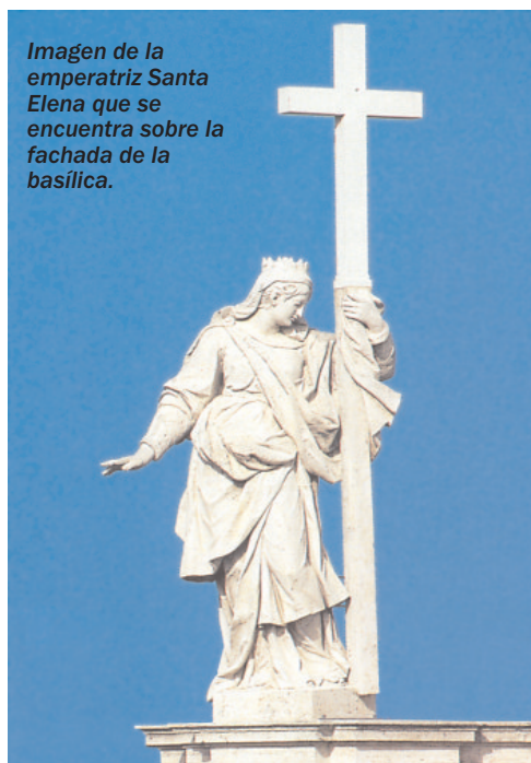
Imagen de la emperatriz Santa Elena que se encuentra sobre la fachada de la basílica.

Los primeros historiadores eclesiásticos comentaban no sin cierta ironía el paradójico resultado que, con el correr del tiempo, tuvieron estos esfuerzos de los paganos. ¡Pobres hombres! -les apostrofaba Eusebio de Cesarea-. ¡Creían que era posible esconder al género humano el esplendor del sol que se había levantado sobre el mundo! Aún no comprendían que es imposible mantener oculto bajo tierra a Quien ha obtenido ya la victoria sobre la muerte 1 . En efecto, en el siglo IV, cuando la Iglesia gozó al fin de libertad, los dos templos paganos permitieron localizar sin margen de error la situación de los Santos Lugares: bastó derruirlos y excavar debajo para encontrar el Santo Sepulcro y la cima del Calvario.