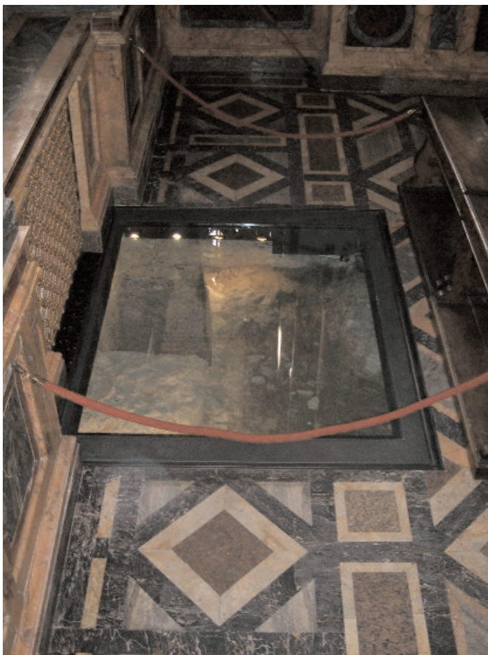
Bajo el altar de la Confessio de la basílica se ha encontrado un sarcófago de mármol, del que se piensa que es aquel en el que se depositaron los restos de San Pablo.