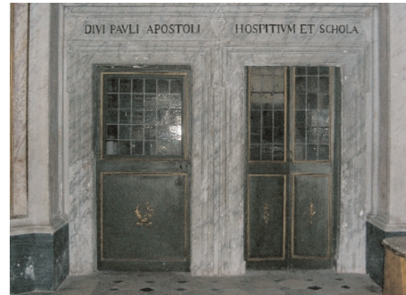
Iglesia de San Paolo alla Regola, edificada donde, según una antigua tradición, se encontraba la casa de San Pablo.