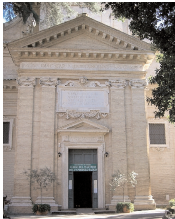
Iglesia de San Pablo ad tres fontes, edificada sobre el lugar de martirio del Apóstol.

apostolado personal, fueron haciendo prosélitos y, durante su cautividad, ya enviaba Pablo a las iglesias los saludos de los cristianos que vivían en la casa del César (Flp 4, 22). Esos cristianos de la casa del César eran funcionarios de la administración imperial. A los cristianos de Filipos sin duda les daba alegría comprobar que el Evangelio había llegado también a esos ambientes, desde los que tanto podía hacerse para cambiar la sociedad.