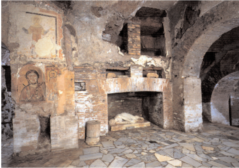
Cripta de Santa Cecilia.