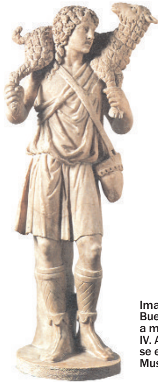
Imagen del Buen Pastor esculpida a mediados del siglo IV. Actualmente se encuentra en los Museos Vaticanos.

nando esas palabras que Cristo pronuncia en el Evangelio: Yo soy el Buen Pastor. El Buen Pastor da su vida por sus ovejas 9 . Como ha testimoniado el Prelado del Opus Dei, san Josemaría meditó durante toda su vida las escenas evangélicas del Buen Pastor. Amaba