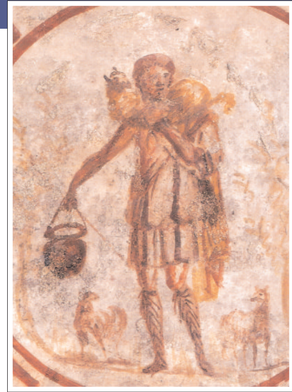
Imagen del Buen Pastor que decora una bóveda en las Catacumbas de San Calixto. Fue pintada por los cristianos del siglo III.

martirio siempre estaba presente: bastaba la acusación de un enemigo para que se diera inicio a un proceso. Quien se convertía era plenamente consciente de que el cristianismo suponía una opción radical que implicaba la búsqueda de la santidad y la profesión de la fe, llegando –si fuera necesario– a la entrega de la propia vida. El martirio era considerado entre los fieles un privilegio y