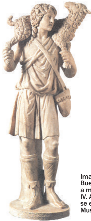
Imagen del Buen Pastor esculpida a mediados del siglo IV. Actualmente se encuentra en los Museos Vaticanos.

nando esas palabras que Cristo pronuncia en el Evangelio: Yo soy el Buen Pastor. El Buen Pastor da su vida por sus ovejas 9 . Como ha testimoniado el Prelado del Opus Dei, san Josemaría meditó durante toda su vida las escenas evangélicas del Buen Pastor. Amaba