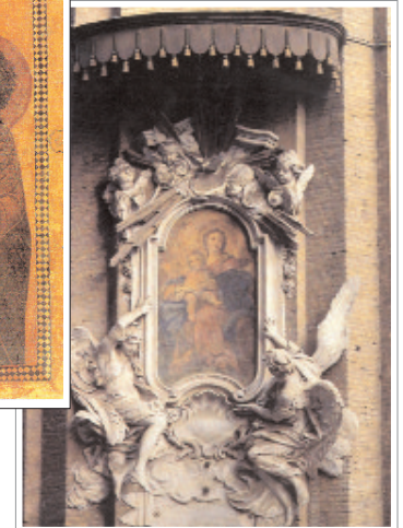
Por las calles de Roma hay centenares de edicole de la Virgen. En el centro, el icono de Santa María Salus Populi Romani, una de las imágenes de Nuestra Señora más veneradas en la Urbe.

pero algunos autores sugieren que la difusión de esta costumbre está relacionada con una de las imágenes más queridas por los habitantes de la ciudad, venerada en la Basílica de Santa María la Mayor y conocida como Salus Populi Romani . Según una antigua tradición, el nombre de este icono se debe a un milagro ocurrido en el año 590. Roma estaba invadida por la peste, y sus habitantes llevaron esta Virgen en procesión desde Santa María la Mayor hasta San Pedro, para implorar el fin de la epidemia. A la altura del mausoleo de Adriano, apareció un ángel que envainaba una espada, dando a entender que por intercesión de la Madonna cesaba el mal. Desde ese momento, la fortaleza comenzó a llamarse Castel Sant'Ange-