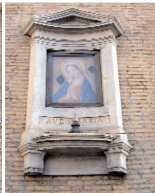
Edicola situada en la Piazza delle Cinque Lune.

En la fachada de Via di Villa Sacchetti, n. 36 se encuentra una imagen de la Virgen de Loreto que -por deseo de san Josemaría- sigue esta tradición romana de enriquecer las fachadas de las casas. En 1957 estaba terminándose la construcción de esta parte del edificio y el fundador del Opus Dei quiso que se pusiera una Madonnella al estilo romano, con un soporte para colocar flores y encender velas. De esta manera, todo el que pasara por allí podría implorar la protección de Santa María. En la Piazza delle Cinque Lune, hay una edicola que tiene una